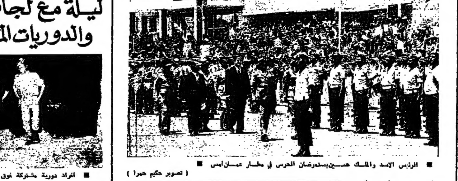
الرئيس الاسد والملك حسين يسترضان الحرس في مطار عمان امس